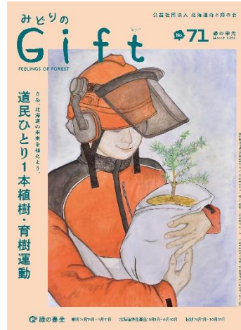
20. 広報誌「みどりのGift」(A4版、16ページ)