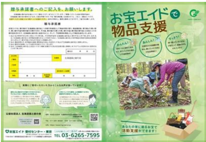
15. お宝募金チラシ(A3版二つ折り、両面)