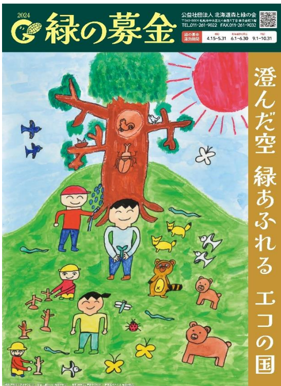
18. 緑の募金ポスター(森と緑の会)