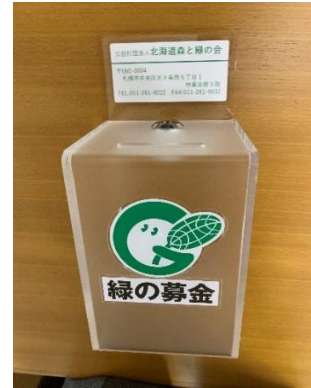
6. 卓上募金箱2(透明プラ製)