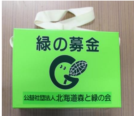
4. ストラップ付募金箱(厚紙製)