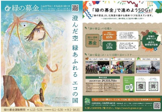
13. 緑の募金チラシ(A4版、両面)