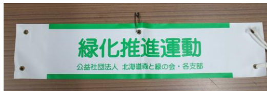
8. 腕章2(緑化推進運動)