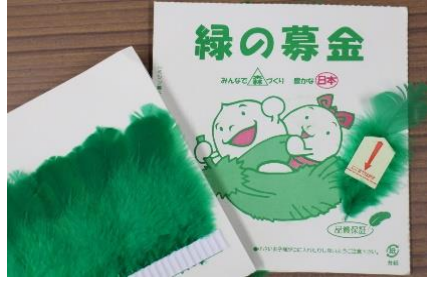
2. 緑の羽根(シール付100本/冊)