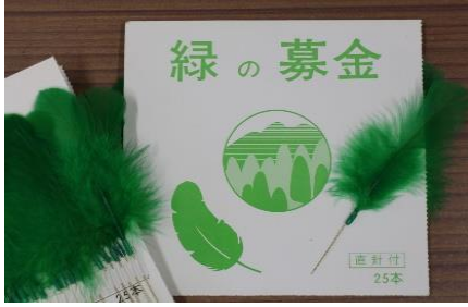
1. 緑の羽根(針付100本/冊)