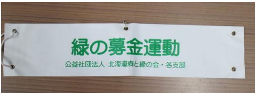
7. 腕章(緑の募金運動)