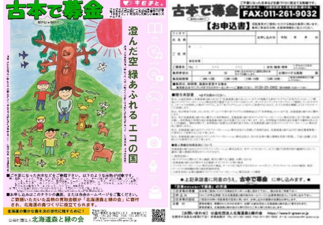
14. 古本募金チラシ(A4版、両面)