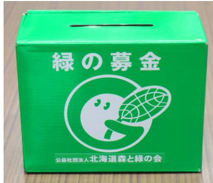
5. 卓上募金箱(厚紙製)