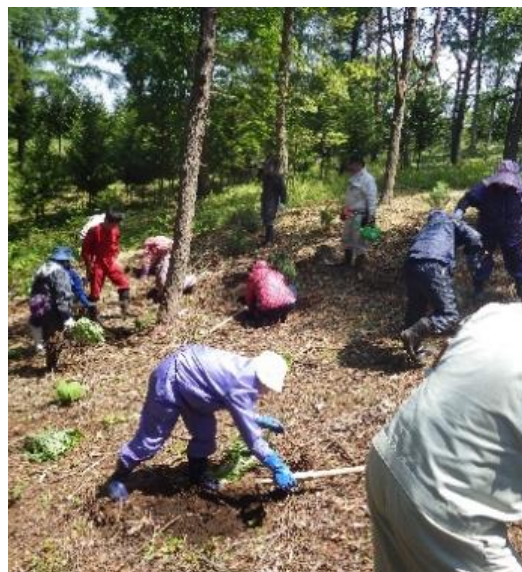
JFひやま漁協女性部江差支部