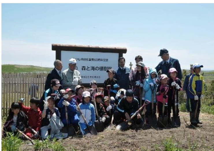
えりも漁協女性部